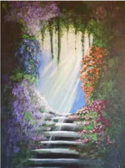
Illustration: Trixi Schönbuchner