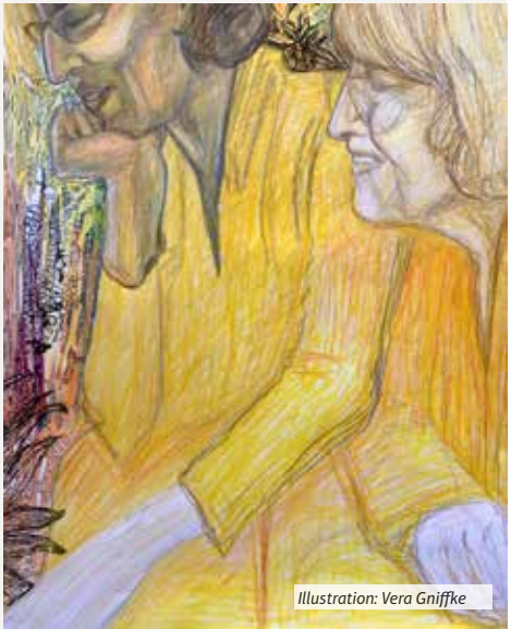
Illustration: Vera Gniffke

„Gott spricht: Ich lasse dich nicht fallen und verlasse dich nicht.“