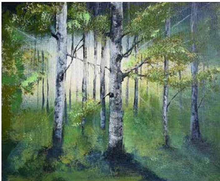
Illustration: Trixi Schönbuczhner

„Die Sorge um die Natur, die Gerechtigkeit gegenüber den Armen, das Engagement für die Gesellschaft und der innere Friede (sind) untrennbar miteinander verbunden“ (LS 10)