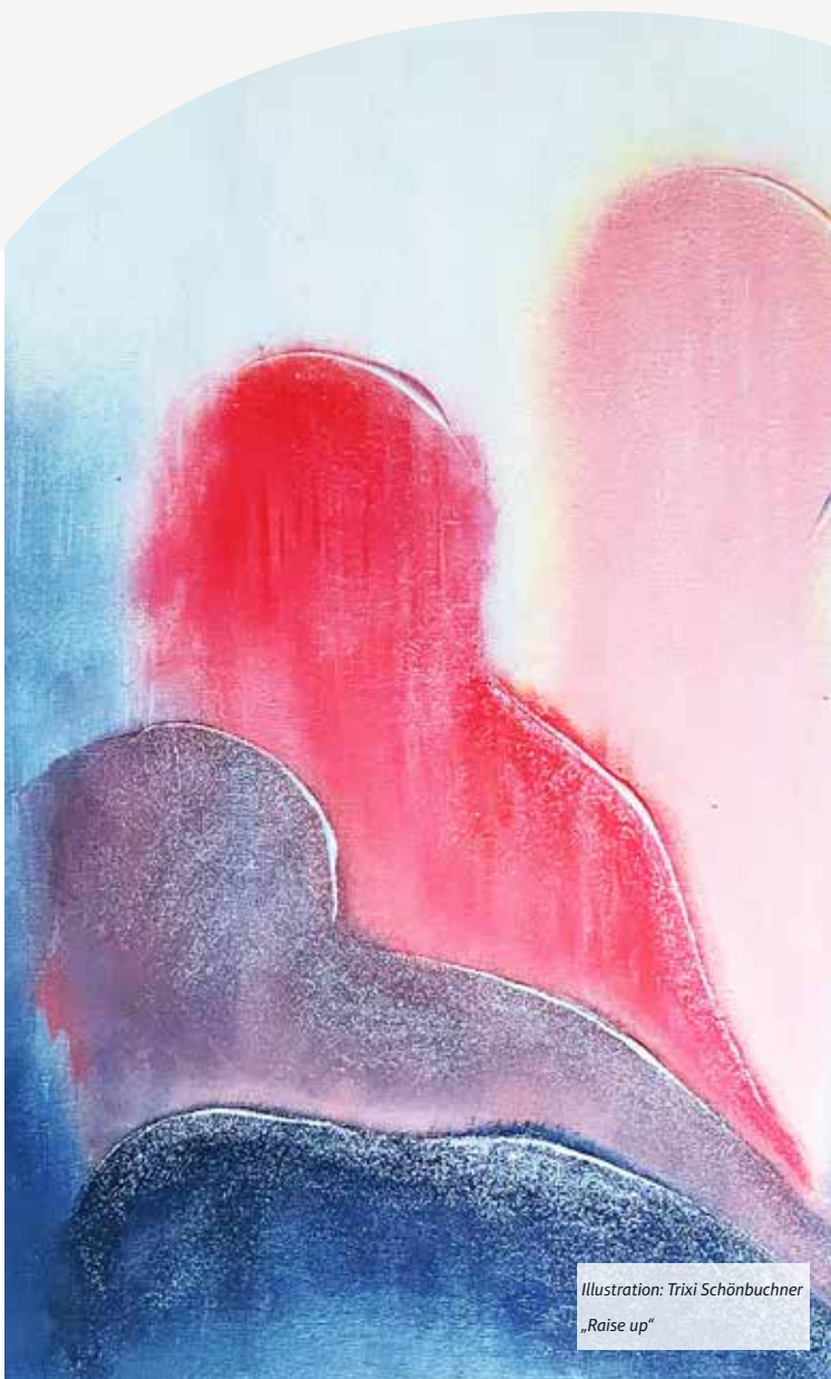
Illustration: Trixi Schönbuchner „Raise up“