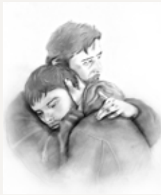
Illustration: Trixi Schönbuchner

Trauer ist der erste Schritt auf dem Weg in eine neue Zukunft.