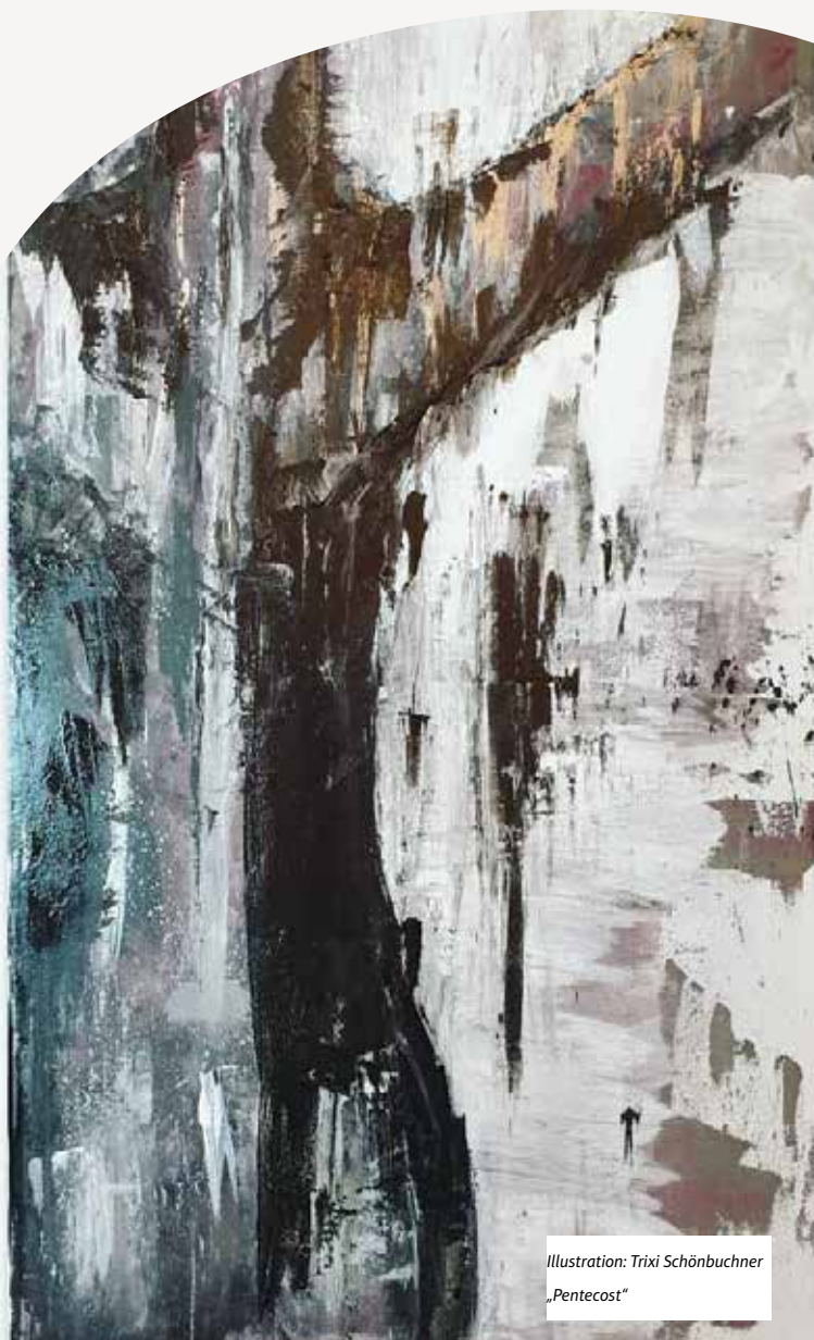
Illustration: Trixi Schönbuchner „Pentecost“