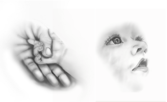
Illustration: Trixi Schönbuchner