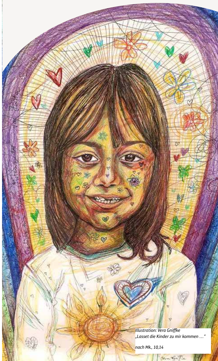
Illustration: Vera Gniffke „Lasset die Kinder zu mir kommen ...“ nach Mk., 10,14