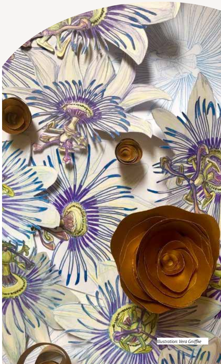
Illustration: Vera Gniffke