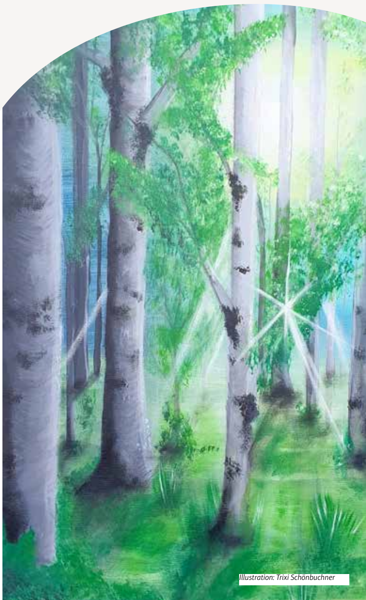
Illustration: Trixi Schönbuchner